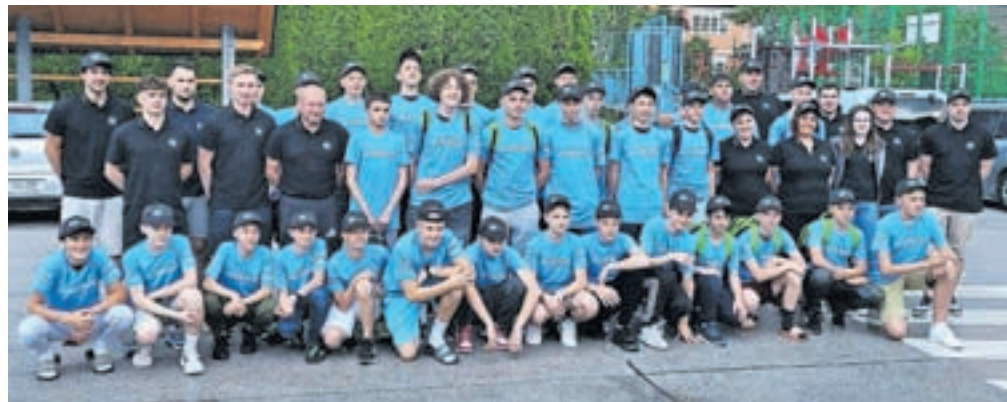
Ekipe, ki se je lani odpravila v Francijo

stopili še dve naši ekipi, in sicer Ambrož Krvavec v Amiensu, kjer bodo nastopale tudi ekipe iz Anglije, Belgije, Danske, Poljske, Nizozemske, Francije in Slovenije, ter Petrofer Mur-nik Krvavec v Wimereuxu, kjer bodo tekmovali tudi ekipe iz Francije, Kanade, Belgije, Poljske, Anglije, Nizozemske in Slovenije. Naši otroci so tudi sicer zelo zadovoljni z uvrstitvami in igrami na tem turnirju. Pravo doživetje jim pomeni druženje z vrstniki iz drugih delov sveta in spoznanje, da tudi sami dobro znajo angleško. Ob tej priložnosti bi se radi zahvalili vsem, zlasti pa staršem, sponzorjem in donatorjem, ter občanom in županu Občine Cerklje, ki nas podpirate na naši športni poti.