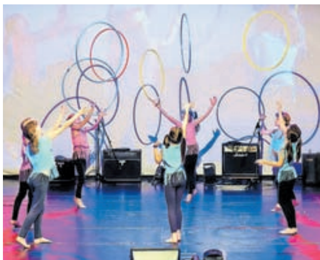
Plesni nastop ob skladbi Sreča na vrvi