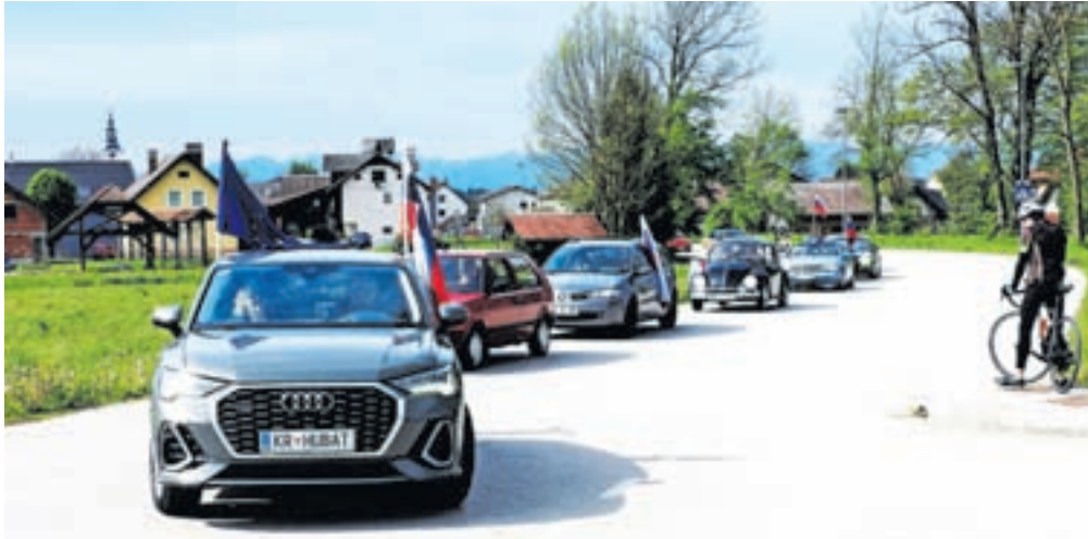
V paradni vožnji je letos sodelovalo kar 161 vozil.