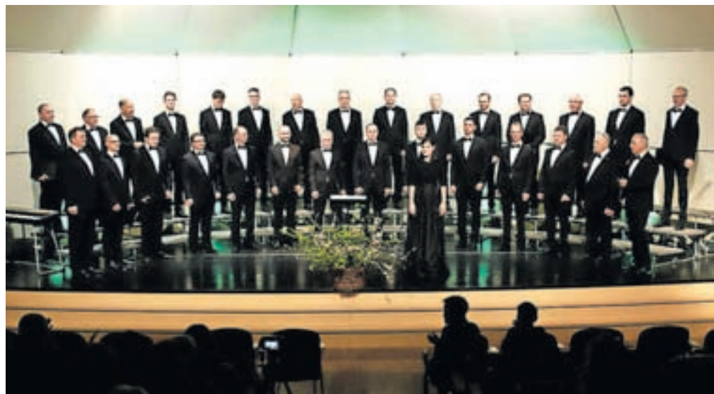
Po uspešno zaključenem letnem koncertu

Pevci Komornega moškega pevskega zbora (KMoPZ) Davorina Jenka so imeli sredi aprila letni koncert z naslovom Si vox est, canta! – Če imaš glas, poj! , v maju pa so zapeli skupaj z Ljutomerskim oktetom.