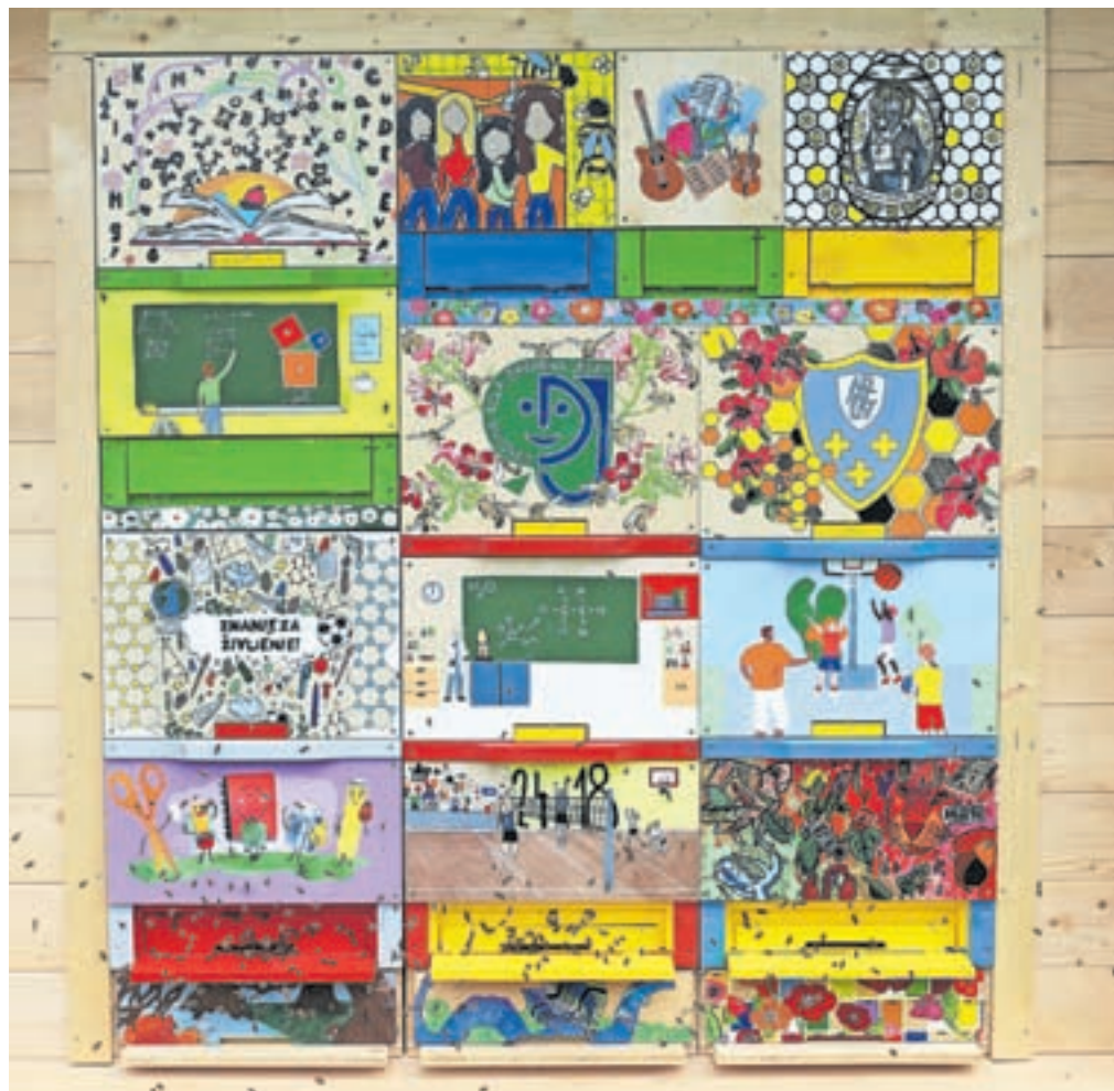
Za panske končnice so poskrbeli v osnovni šoli.

Tako je. Že ob prijavi na razpis smo se o tem pogovarjali, kasneje se je porodila še kakšna ideja. In verjetno bomo našli še katero. V zadnjih letih čebelarji še dodatno sodelujemo tako s šolo kot vrtcem. V vrtcih smo vsako leto prisotni pri tradicionalnem slovenskem zajtrku, ki se je razvil iz prvotnega t. i. medenega zajtrka. Zainteresiranim predstavimo čebelarke vsebine za posamezni starostni nivo in njihove predlagane vsebine. Če bo interes, in najbrž bo, bomo tako prakso nadaljevali. Ker je v prihodnjih letih v načrtu tudi sodobna zunanja učilnica, bo taka predavanja možno organizirati tik ob čebelnjaku, saj bo učilnica takoj za njim. Končna izbira lokacije za čebelnjak je to že upoštevala. Tudi dan odprtih vrat slovenskih čebelarjev bo po novem lahko organiziran ob učnem čebelnjaku. Če bo vreme dopuščalo, bo to prvič organizirano nekaj dni po odprtju, in sicer prav na sve-