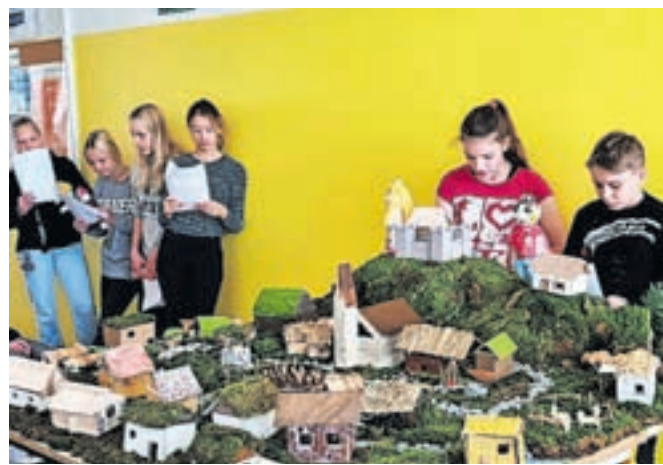
Povest o Brnekarjevem gradu je zaživela tudi v lutkovni igrici.

lavnicah klekljanja, polstenja in šole kot nekoč. Na predmetni stopnji so se učenci поблиže seznanili s Poženčanovim delom: v okviru pritrkovalskega dne so na vadbene zvonove preigrali melodije Poženčanovih pesmi, aktivno spoznavali zvonove kot glasbilo, razvoj pritrkovanja v Cerkljah, pritrkovalske melodije in načine zapisovanja ter z iskanjem novih lastnih glasbenih idej izražali svojo ustvarjalnost. V povezavi z znano povestjo o propadu poženškega gradu so otroci izdelali maketo srednjeveške vasi z gradom in kmečkimi domačijami v okolici, povest ubesedili po svoje, jo ob pomoči lutk odigrali, nekateri pa prenesli tudi v angleški strip.