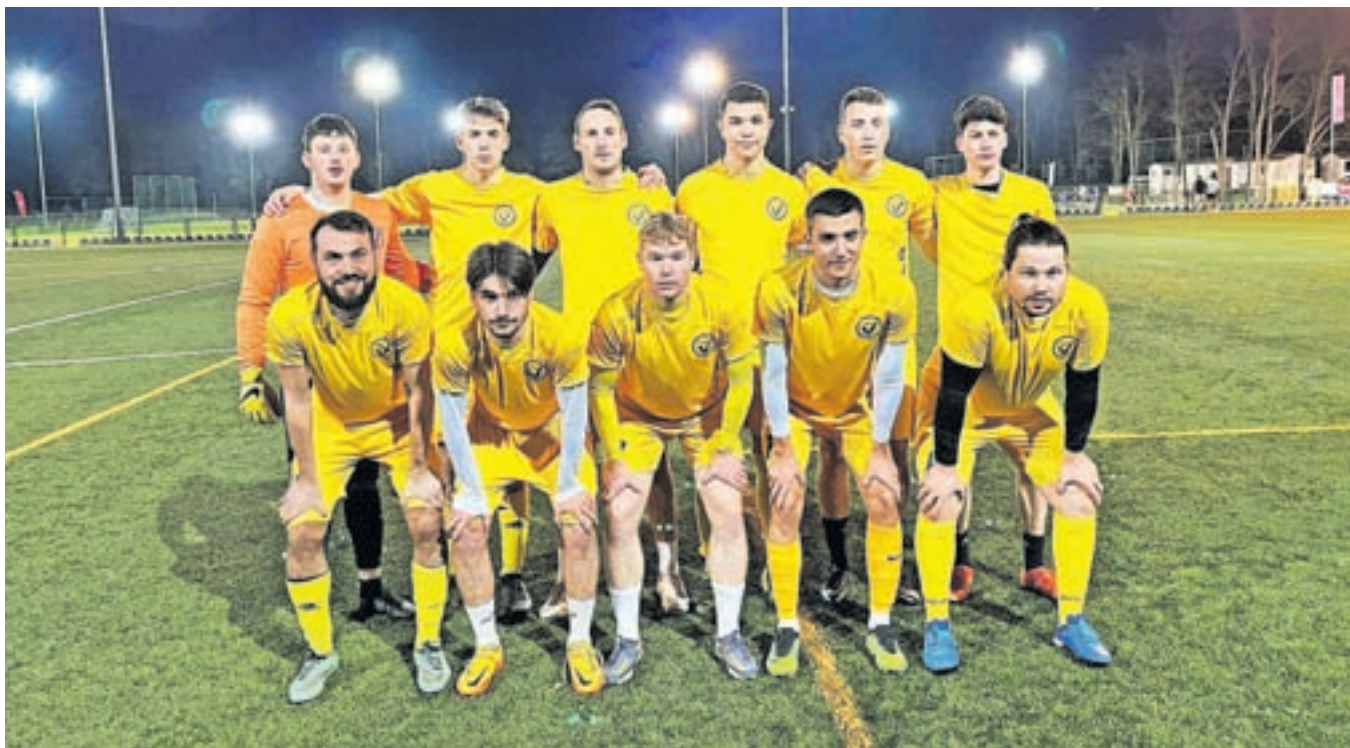
Članska ekipa NK Velesovo Cerklje, ki nastopa v Ligi za prvaka MNZ Gorenjske

Če smo po eni strani hvaležni občini za nogometni balon, ki predvsem najmlajšim nogometašem omogoča odlične pogoje skozi celotno sezono, pa se po drugi strani vse bolj srečujemo s prostorsko stisko za nemoteno treniranje in v zimskem času s pomanjkanjem terminov za starejše selekcije in člansko ekipo. Če bomo v prihodnje želeli narediti korak naprej tudi v rezultatskem smislu, bo zagotovo potrebna preureditev pomožnega igrišča in položitev umetne trave.