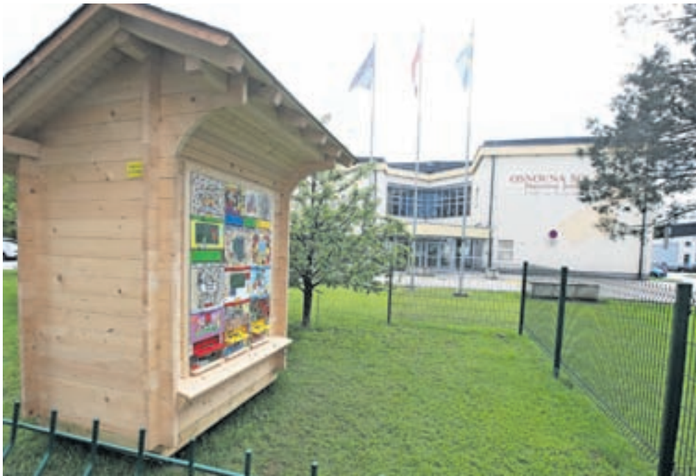
Novi učni čebelnjak