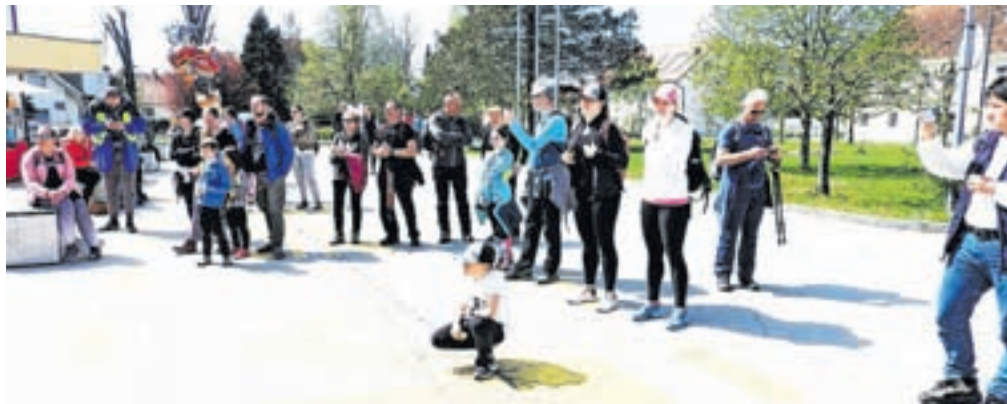
Pohod k sosеду se je zaključil pred osnovno šolo v Cerkljah.

škega igralca, režiserja in pedagoga Ignacija Borštnika ter izvedeli še nekaj več o drugih slavnihih možeh iz Cerkelj. Pohod se je zaključil na Cerkljanski tržnici z bogračem, ki so ga za pohodnike skuhal v Planinskem domu v Komendi. Izkupiček pohoda bodo namenili Župnijski karitas Cerklje za prizadete ob potresu v Turčiji. Letošnji pohod k sosеду je bil drugi po vrsti, lani so obiskali Vodice.