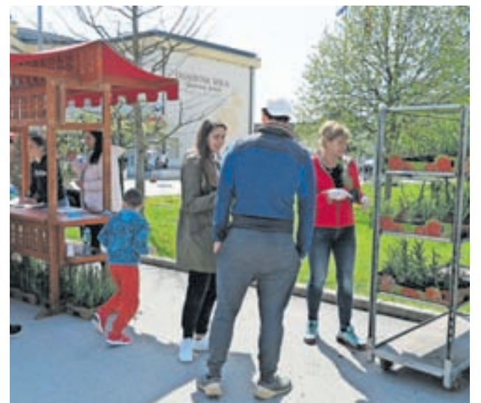
Na aprilski tržnici je Društvo kmečkih in podeželskih žena Gorenjski nagelj razdelilo tisoč sadik gorenjskih nageljnov.