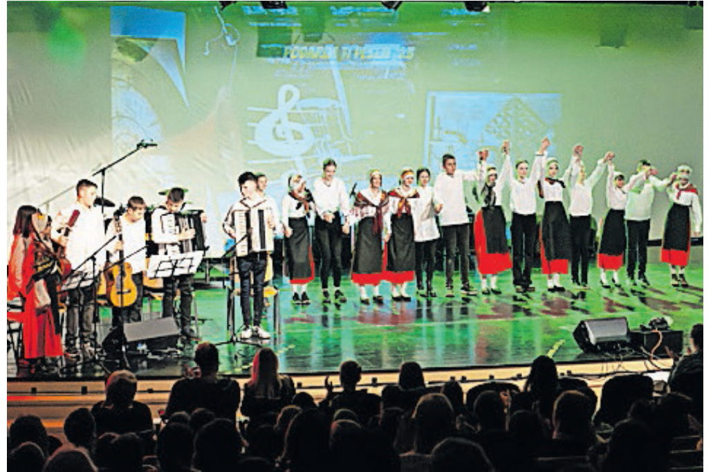
Nastop gostov iz Sarajeva