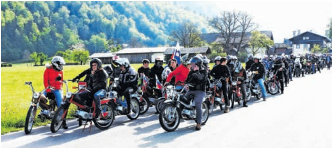
Pred začetkom parade