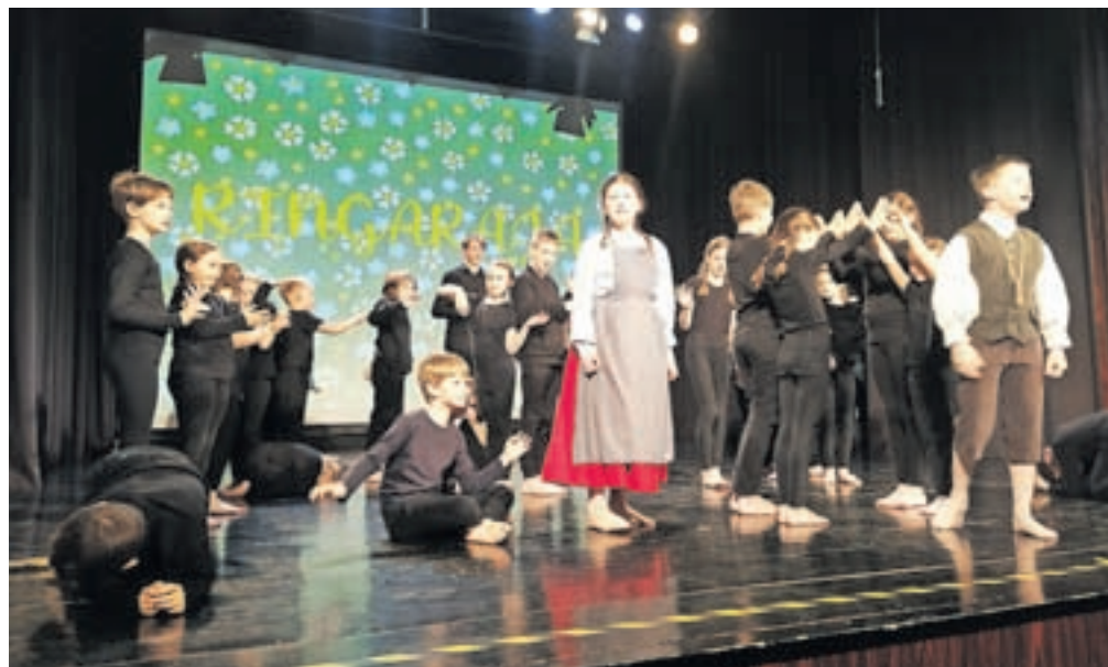
Nastop na Regijskem srečanju otroških folklornih skupin Ringaraja

Cerklje – Trudimo se, da pozabljene običaje, plese in pesmi potegnemo iz zaprte skrinje pozabe, jih oživimo in jim dodamo pridih mladosti. S tem skušamo naše izročilo približati mladim in jim vzbuditi zavest o pomenu njegovega ohranjanja za prihodnje rodove. Velik poudarek dajemo domačemu izročilu, torej gorenjski pokrajini. Nastopili smo na šolskih prireditvah ob počastitvi različnih praznikov, pripravili smo sprejeme in delavnice slovenskih ljudskih plesov in pesmi za otroke in učitelje, ki so prišli k nam v okviru projektov Erasmus+, izvedli delavnice za naše šolarje v okviru projekta Unesco, sodelovali smo z upokojensko Folklorno skupino Cerklje na Večeru folklorne in Skupaj se 'mamo fletno, popestrili smo program ob prevzemu šolskega čebelnjaka in na prireditvi Kulturo šola na ogled postavili. Ponosni pa smo tudi, ker