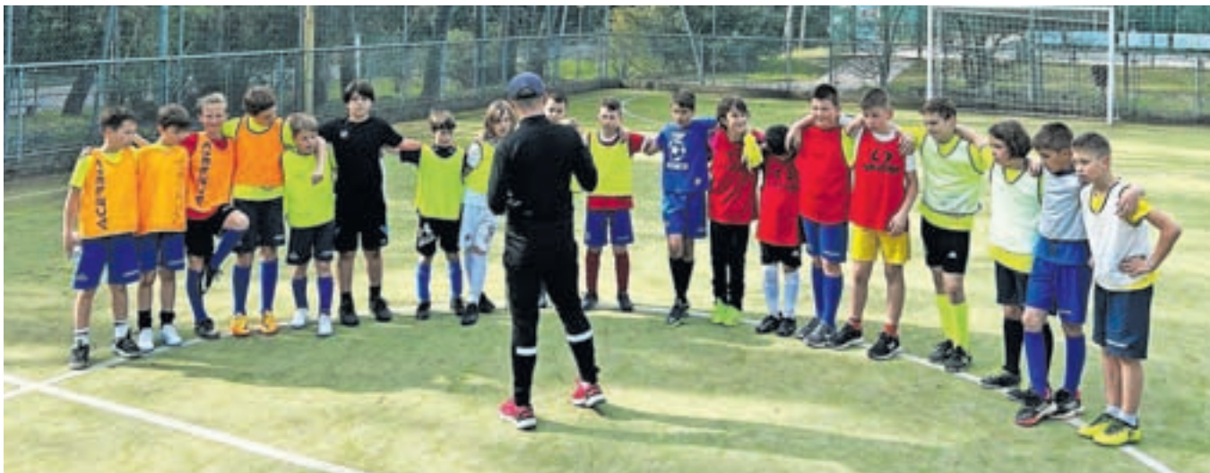
Ekipa U11 s trenerjem Jakom na pripravah v Lignanu