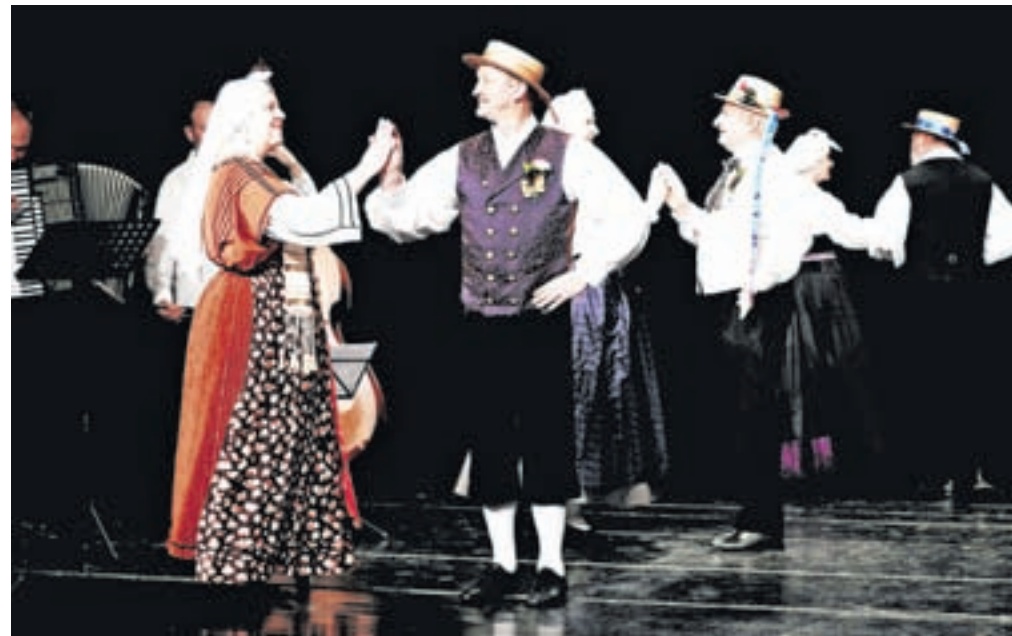
Folklorna skupina Tine Rožanc iz Ljubljane

Folklorna skupina Folklore Cerklje deluje osemnajsto leto. Ima 24 članov, ki veliko nastopajo na različnih prireditvah v občini in po Sloveniji pa tudi v tujini. Njihov strokovni vodja je od januarja 2020 Miran Murnik, ki je nasledil Braneta Šmida. Na Večeru folklore so zaplesali splet gorenjskih plesov z naslovom Na cerkljanski tržnici in Birtovsko .