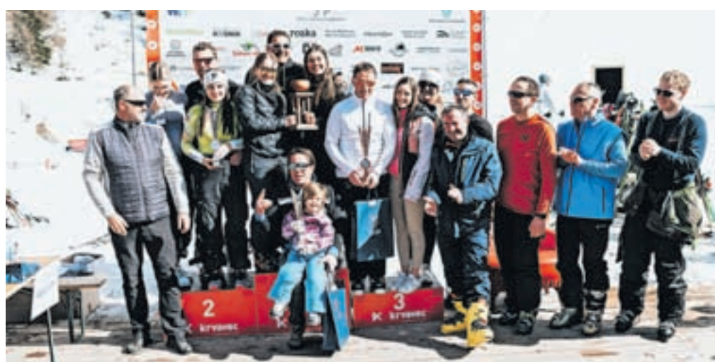
Najhitrejši predstavniki podjetij s sedežem v občini Cerklje

se jim zahvaljujemo. Še posebno smo bili veseli velikega obiska cerkljanskih otrok, saj jih je tekmovalo kar 40, upamo pa, da jih bo v prihodnje še več. Skupno 130 tekmovalcev se je pomerilo v različnih starostnih kategorijah, dodatno pa se jim je čas lahko štel tudi v razvrstitvi med podjetji ali vaškimi skupnostmi.