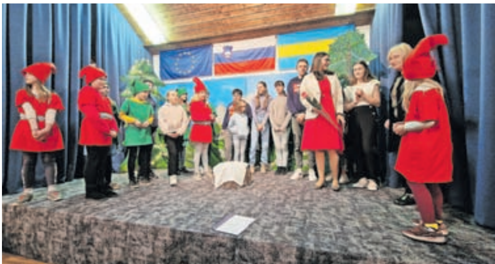
Na prireditvi ob materinskem dnevu so nastopili osnovnošolci in dijaki.

V drugem delu prireditve smo si ogledali televizijski film Vrnitev režiserja Antona Tomašiča, ki je bil posnet leta 1976 in pripoveduje zgodbo mladega zavednega koroškega Slovenca. Film je za nas zanimiv zato, ker je veliko prizorov posnetih v naši vasi, nekaj kadrov pa tudi na Zgornjem Brniku. Lepo je prikazano takratno središče vasi pri gasilnem