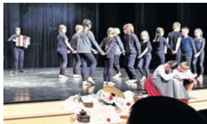
Nastop na prireditvi Skupaj se 'mamo fletno'

Ob koncu uspešnega folklornega šolskega leta nas čaka še zaslužen nagradni izlet. Obenem pa se že veselimo naslednje folklorne sezone, da se naučimo novih korakov, ljudskih pesmi in iger, ter družnja, pogostitev in številnih nastopov.